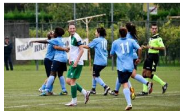
Le ragazze della Fortitudo Mozzecane esultano dopo un gol

Chiamatela la «cooperativa del gol». Sei reti realizzate, sei marcatrici diverse. Un'imprevedibilità offensiva, dopo due giornate di Serie B, fondata su un gioco corale, e di squadra, più che sulla singola individualità. La Fortitudo Mozzecane va all'assalto e punge sempre con un'attrice diversa, perché al tavolo del gol si siedono in molte e segnare diventa la pietanza principale. Tanto da scomodare e dover aggiornare perfino i libri della storia gialloblù.