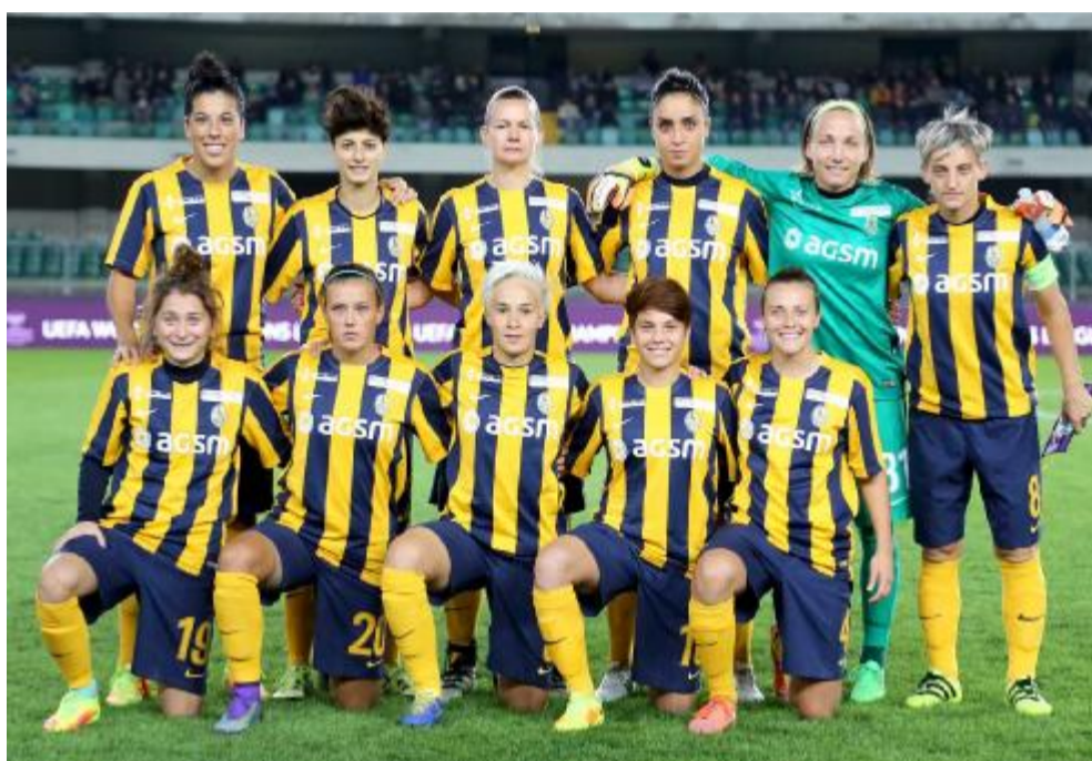
La formazione dell'Agsm Verona oggi giocherà con la Fiorentina